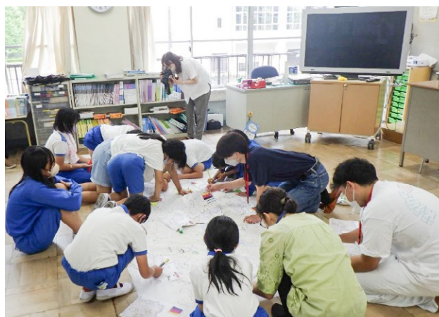
写真-1 小渡小学校におけるマップ作成の様子